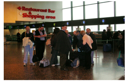
Malpensa Shuttle – bus stop